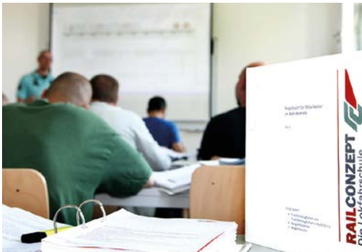
Theoretische Ausbildung am Standort

Die Vermittlung von praktischen Kenntnissen mit Hilfe eines Simulators bereitet die Teilnehmenden auf das Betriebspraktikum vor, durch das Kenntnisse und Kompetenzen in der Praxis vertieft werden.