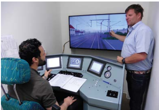
Praktische Ausbildung am Simulator

Wenn Sie sich für den Beruf des Triebfahrzeugführers interessieren, bilden wir Sie qualitativ hochwertig, umfassend und nachhaltig aus.